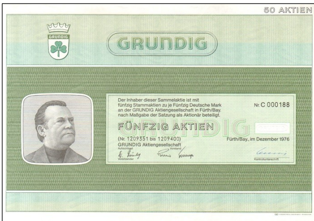
G3535 - Akcie GRUNDIG AG na 50x 50 DEM z prosince 1976