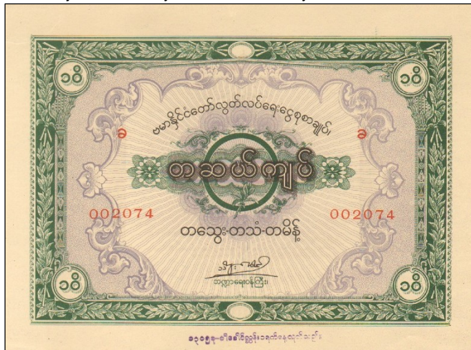
E6752 - Státní dluhopis Barmy, vydaný v roce 1944 na 10.000 kytatů