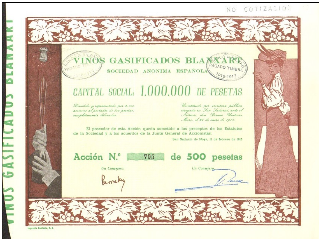
E3420 – Akcie španělské firmy Vinos Gasificados Blanxart S.A. Española na 500 ESP, vydaná údajně 11. 2. 1916 v San Sadurn de Noya