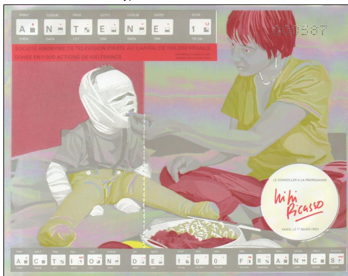
G3531 - jedna z barevných mutací akcie firmy Antene 1 z roku 1983