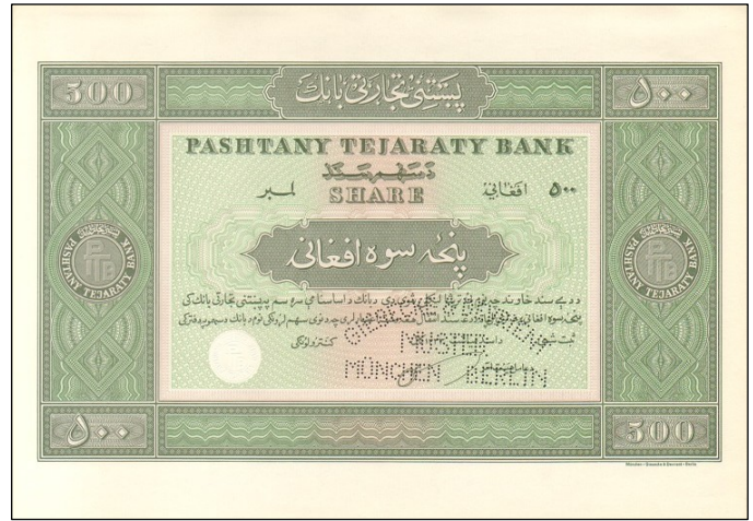
G3534 - Akcie afghánské Pashtany Tejaraty Bank na 500 afghání